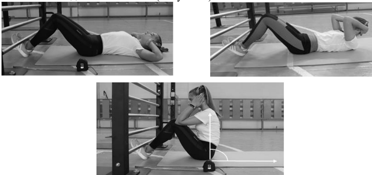
Рисунок 1 - Схема выполнения

Поднимание туловища выполняется на гимнастических матах из положения лежа на спине руки за головой, локти разведены в стороны, касаются гимнастического мата, ноги согнуты в коленных суставах под углом 90 градусов, ступни ног прижаты партнером к полу. По команде «Марш!» учащийся выполняет максимальное количество повторений туловища за 1 мин, касаясь локтями бедер (коленей), с последующим возвратом в И.П. до касания лопатками гимнастического мата. Учитывается количество подъемов за 60 сек. (Рисунок 1).