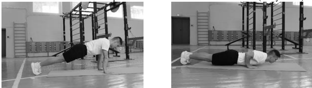
Рисунок 2 – Схема выполнения

Сгибание и разгибание от пола из исходного положения – упор лежа, руки располагаются на ширине плеч (кисть под плечом). Необходимо при сгибании и разгибании рук в локтевом суставе сохранять туловище прямым (голова, плечи, таз одна линия). При сгибании рук (угол сгибания в локтевом суставе более 90^\circ , угол отведения плеча не более 45^\circ ) грудь приближать к полу на расстояние 7-8 см. при нарушении техники тест прекращается, засчитывается количество правильно выполненных отжиманий. (Рисунок 2)